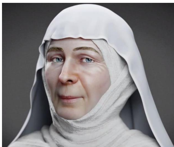
Svatá Ludmila podle unikátní rekonstrukce českých vědců