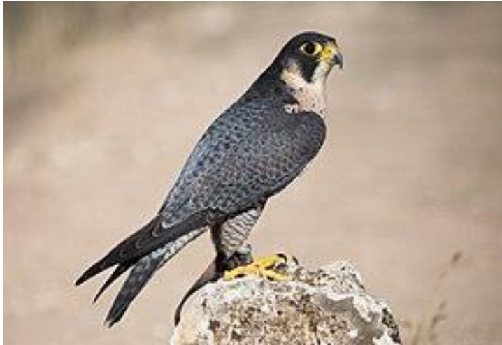
Autor – Ema Tučnicková

Sokol stěhovavý má rozpětí křídel okolo 100 cm a délka těla je přibližně 40 cm. Samci váží téměř 800 g, samice jsou větší okolo 1 000 g. Je to nejen velký dravec, ale i celosvětově rozšířený sokolovitý pták. Žije převážně hodně na severu, ale několik jeho poddruhů se rozšířilo do střední Evropy, a i do Afriky do oblastí kolem rovníku. Ne všechny poddruhy jsou uznávány. Obvykle se uvádí 15-17 někdy 19 poddruhů. Při střemhlavém letu dosahuje maximální rychlosti 390 km/h. Je to asi ten nejrychlejší živočich v přírodě. Nejčastěji loví ptáky